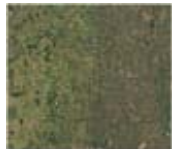
Bereits länger gerodetes und besiedeltes Gebiet