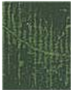
Straße mit ersten Seitenstrassen, die in den Urwald greifen