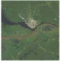
Manaus am Zusammenfluss von Amazonas und Rio Negro.