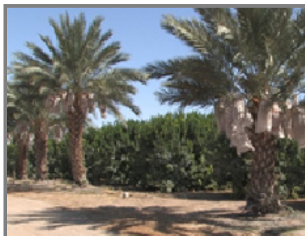
California Fruit Belt