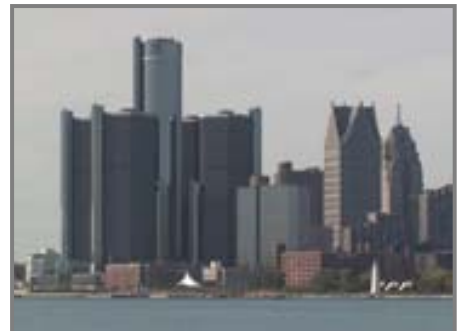
Unternehmenszentrale von GM in Detroit

Ansiedlung großer IT-Betriebe sorgt für Aufschwung.