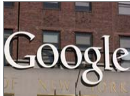
Google-Niederlassung in New York

Ansiedlung von Chemie- und Biotechnologieunternehmen.