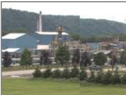
Chemiebetrieb bei Pittsburgh

Ansiedlung von Chemie- und Biotechnologieunternehmen.