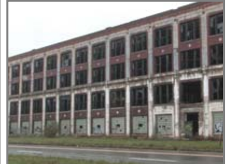
Geschlossene Automobilfabrik in Detroit

Verlagerung des Gewerbes aus der Stadt ins Umland oder in den Sun Belt.