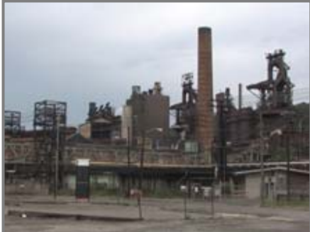
Stillgelegtes Stahlwerk in Pittsburgh

Eisen und Stahl wurde zum großen Teil durch Kunststoffe ersetzt.