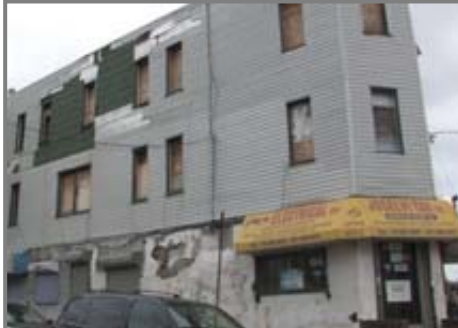
Ehemaliger Elektrofachbetrieb in New York

Eisen und Stahl wurde zum großen Teil durch Kunststoffe ersetzt.