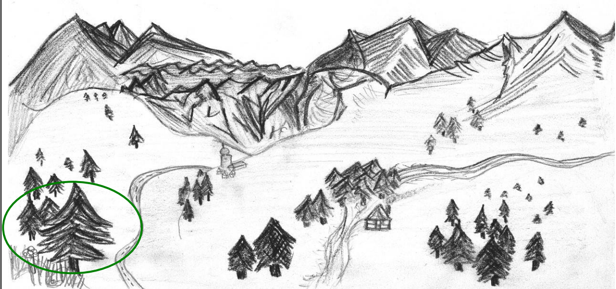
Die Alpen im Jahr 2013