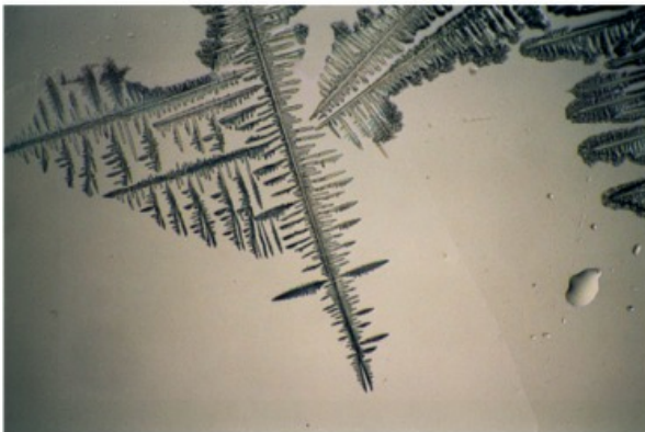
Nach 3 Sekunden